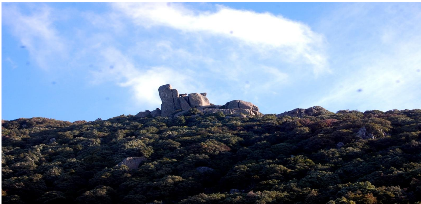
Rocca Sigolla (sull'IGM Sa Golla)