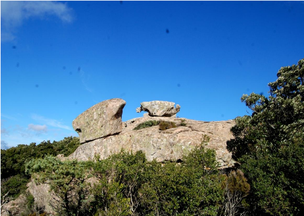
Uno scorcio di graniti di Mont'Arbu