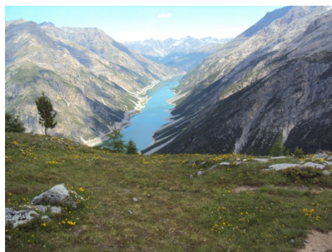
Lago di Livigno (1811 m)