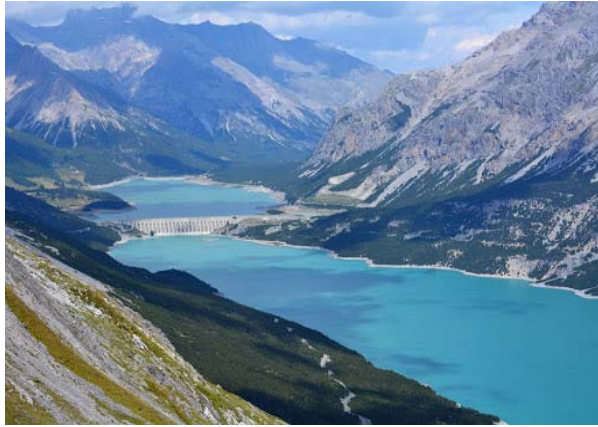
Laghetti di Cancano (1950 m)